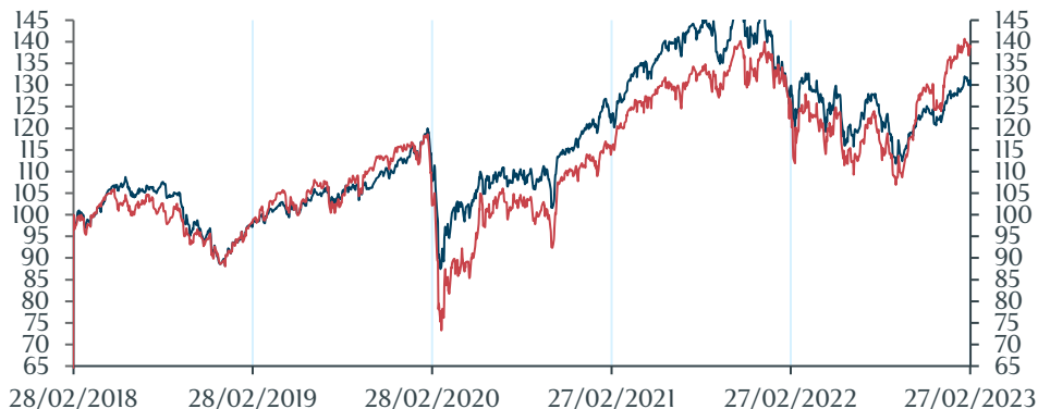
Optigest Europe Indicateur de référence